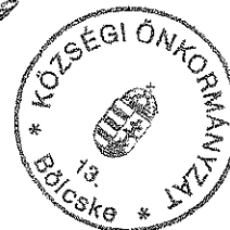
Baranya István polgármester